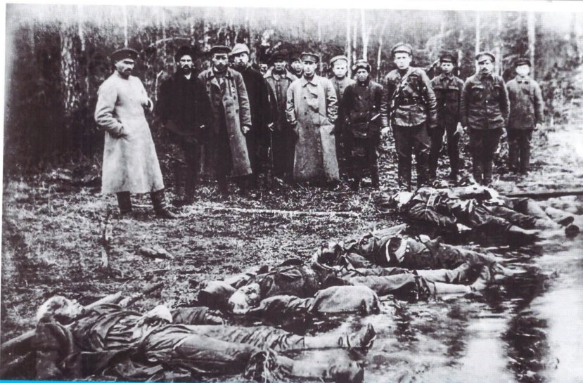
Советская комиссия у тел советских граждан, расстрелянных английскими интервентами на железной дороге. Весна 1920 года

Возвращаюсь к рассказу о том, что происходило здесь, на Юрьевском рубеже. Здесь было три воинских подразделения: 15-й Юрьевский полк, 4-й Нарвский и 3-й Гатчинский полк. Справедливости ради надо сказать, что были и такие, исторически подтвержденные, и, к сожалению, позорные факты в нашей истории: 3-й Гатчинский полк, прибывший в Обозерскую для ее обороны, частично перешел на сторону врага и был разоружен. Это показывает, что вся боевая нагрузка на фронте легла на плечи 15-го Юрьевского и 4-го Нарвского полков. Они несли тяжелые потери убитыми и ранеными. Нельзя забывать, что бойцы — это люди, которые оказались в тяжелейших условиях северной осени, переходящей в зиму — много было и заболевших. Но люди самоотверженно сражаются: 1300 человек здесь, на Юрьевском рубеже, сзади никакой поддержки, все понимают,