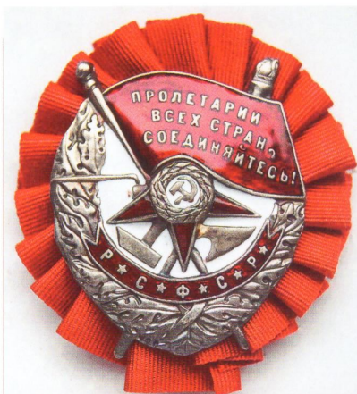
Орден Красного Знамени образца 1918 года