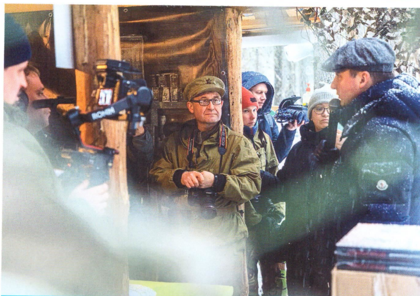
Открытый урок истории, который вел губернатор Архангельской области Александр Цыбульский, прошел, как говорится, на одном дыхании. Лекцию о прошлом и настоящем заворуженно слушали и взрослые, и дети

Так произошло в 1918 году. Так происходило в 1990-х годах, когда распался Советский Союз. К нему можно относиться по-разному: в СССР было и много перегибов, и, наверное, не все было эффективно, что во многом послужило причиной распада. Но, тем не менее, то, что это было государство, без согласия которого не могло быть принято ни одно